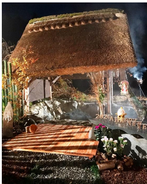
（手作りの茅葺足湯）

内容：「神鍋は知れば知るほど楽しい。」体験して初めて分かる自然の本当の面白さを子どもたちに伝える活動を通じて、神鍋高原の魅力を全国に発信し、地域を元気にする取り組みについてお話を伺います。 また、今暮らしている但馬をもっと楽しむ方法についてお話を伺います。